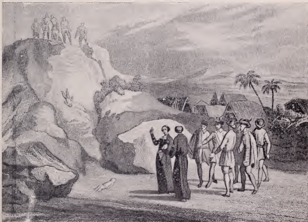
Sacrificios de niños en Guachetá. (Grabado francés del siglo pasado).